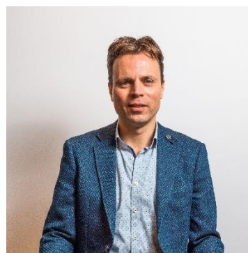
Bronne Pot (3) Bilthoven