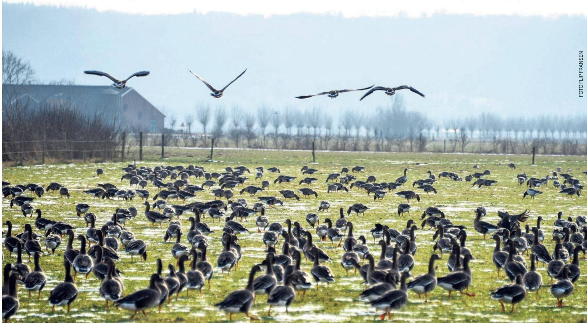
Kolgansen grazen in de winter de Nederlandse graslanden af. Hier foerageren ze in een weiland in de Ooijpolder bij Nijmegen.