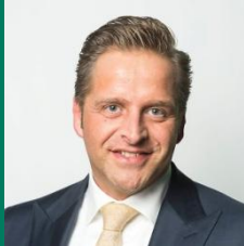
Hugo de Jonge