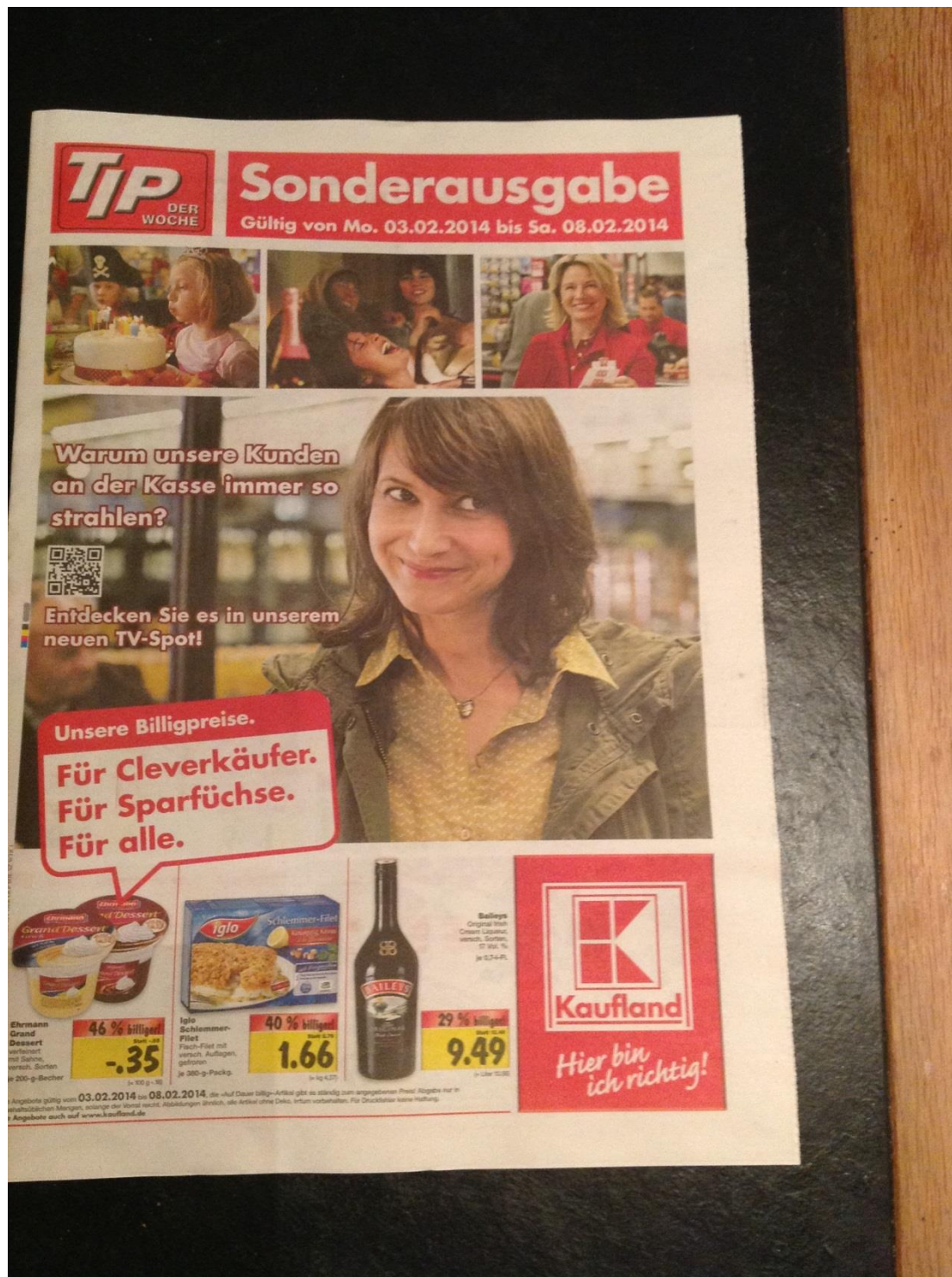
“Een foto van een folder van warenhuis/supermarkt Kaufland in Kleef (D). De folder bestaat uit 12 pagina's met aanbiedingen en wordt wekelijks verspreid in het gebied ten oosten van Nijmegen. Mogelijk ook in het gebied ten oosten van Arnhem omdat in Emmerik ook een Kaufland is.”