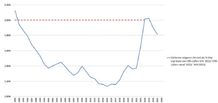
Defensie-uitgaven als percentage van het bbp (jaren 90 t/m 2027)