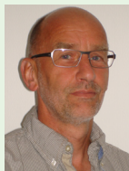
Van de voorzitter