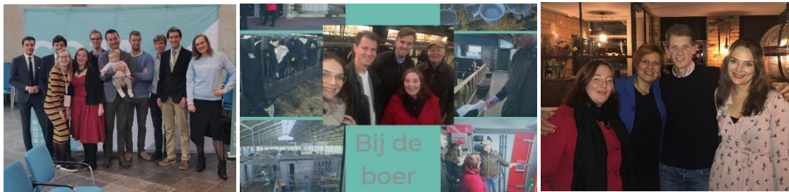
Alle CDJA Noord-Holland-leden die op het CDJA congres in Middelburg waren, inclusief de kleine.

Met vriendelijke groet, CDJA Noord-Holland Noord