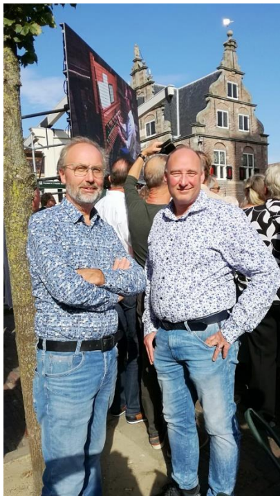
Ingebruikname carillon Grote Kerk De Rijp