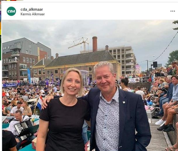
Lichtjesavond Alkmaar 2019