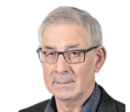
25 AD VAN IERSEL