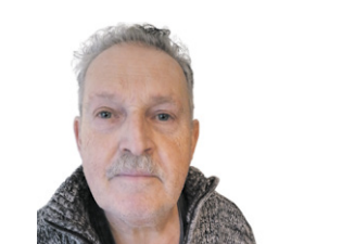
35 AD VAN SEGGELEN