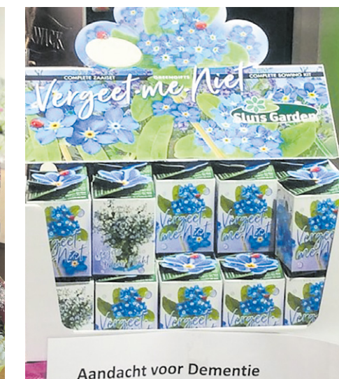
Aandacht voor Dementie