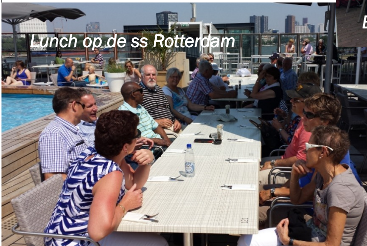
Lunch op de ss Rotterdam