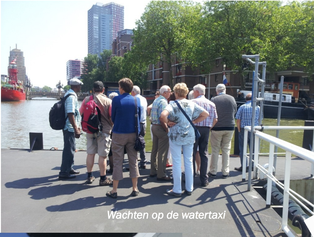
Wachten op de watertaxi