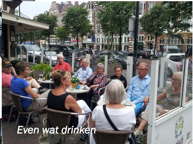
Even wat drinken