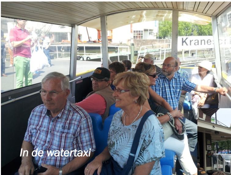
In de watertaxi