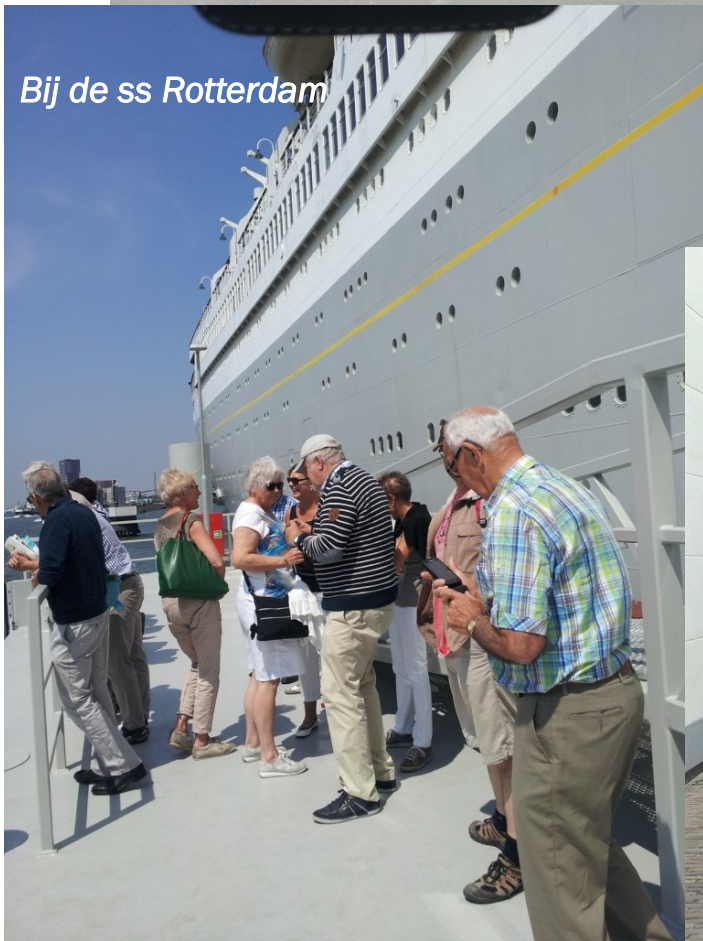
Bij de ss Rotterdam