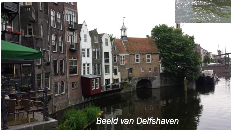
Beeld van Delfshaven