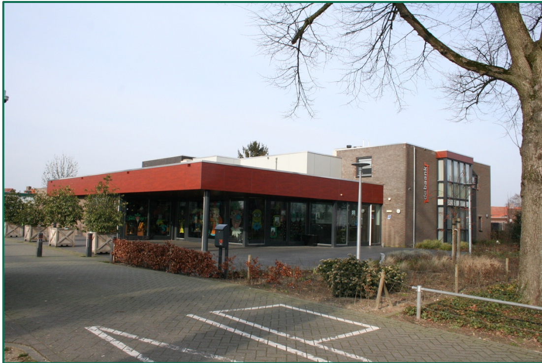
De Baank Leunen

CDA Venray wil de komende jaren blijven werken aan sterke buurten, wijken en dorpen; aan een samenleving waar alle mensen zich veilig en thuis voelen, omdat ze weten dat er altijd iemand is die naar hen omkijkt. Niemand staat er alleen voor. Een sterke samenleving van betrokken gemeenschappen is gebouwd op saamhorigheid en gedeelde verantwoordelijkheid, en geeft mensen directe invloed op hun eigen leefomgeving. CDA Venray gaat uit van het goede in de mens; vertrouwen geven aan de maatschappij is daarom belangrijk. De gemeente Venray is bovenal dienstbaar aan inwoners, bedrijven en organisaties. Een sterke samenleving laat meer ruimte voor eigen keuzes. Dat betekent minder regels van bovenaf en meer zeggenschap voor inwoners zelf.