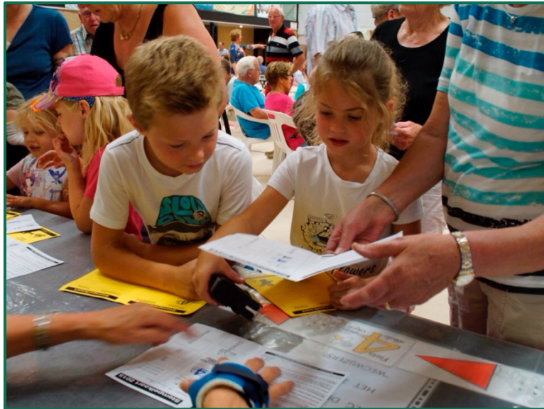
Inschrijving voor de Venrayse fietsvierdaagse

Families vormen het fundament van Nederland. Kinderen groeien op in warme en verantwoordelijke gezinnen van welke samenstelling dan ook. Voor het CDA is elk gezin van waarde. Gezinnen vormen het startpunt van ons leven waar we, in geborgenheid mogen opgroeien. Ook zien we steeds meer samengestelde gezinnen. Prima, waar het om gaat is dat kinderen veilig en zorgeloos kunnen opgroeien. De zorg in Venray zou ondenkbaar zijn zonder de inzet en aandacht van mantelzorgers. Wij hebben daar grote waardering voor en voelen het als een plicht om hun zorg te ondersteunen en te vergemakkelijken.