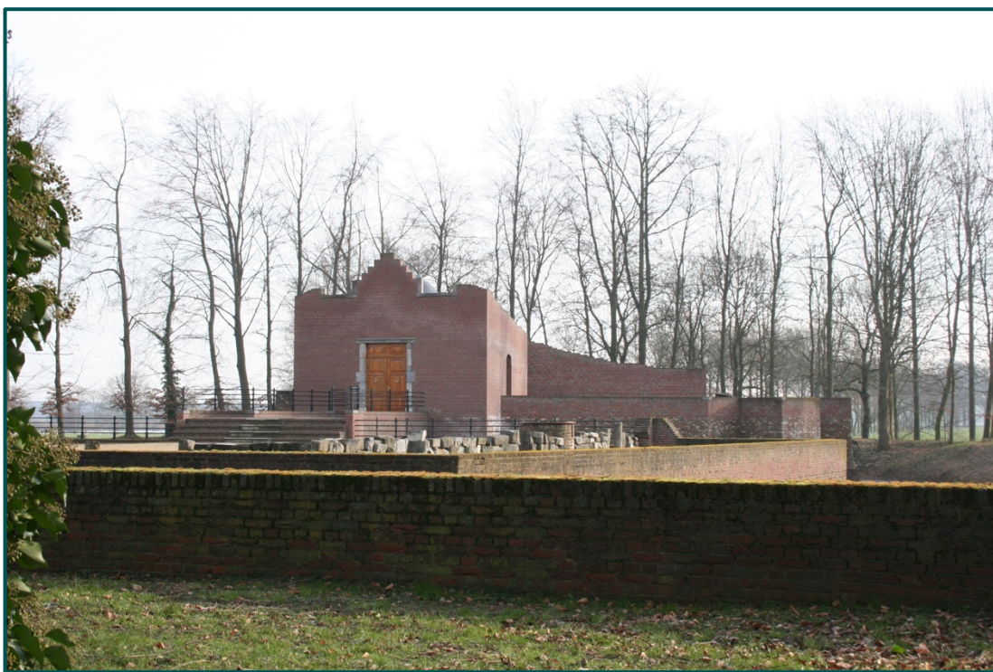
Het kasteel Geijsteren