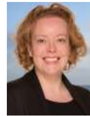
Sietske Poepjes CDA Gedeputeerde Provincie Fryslân