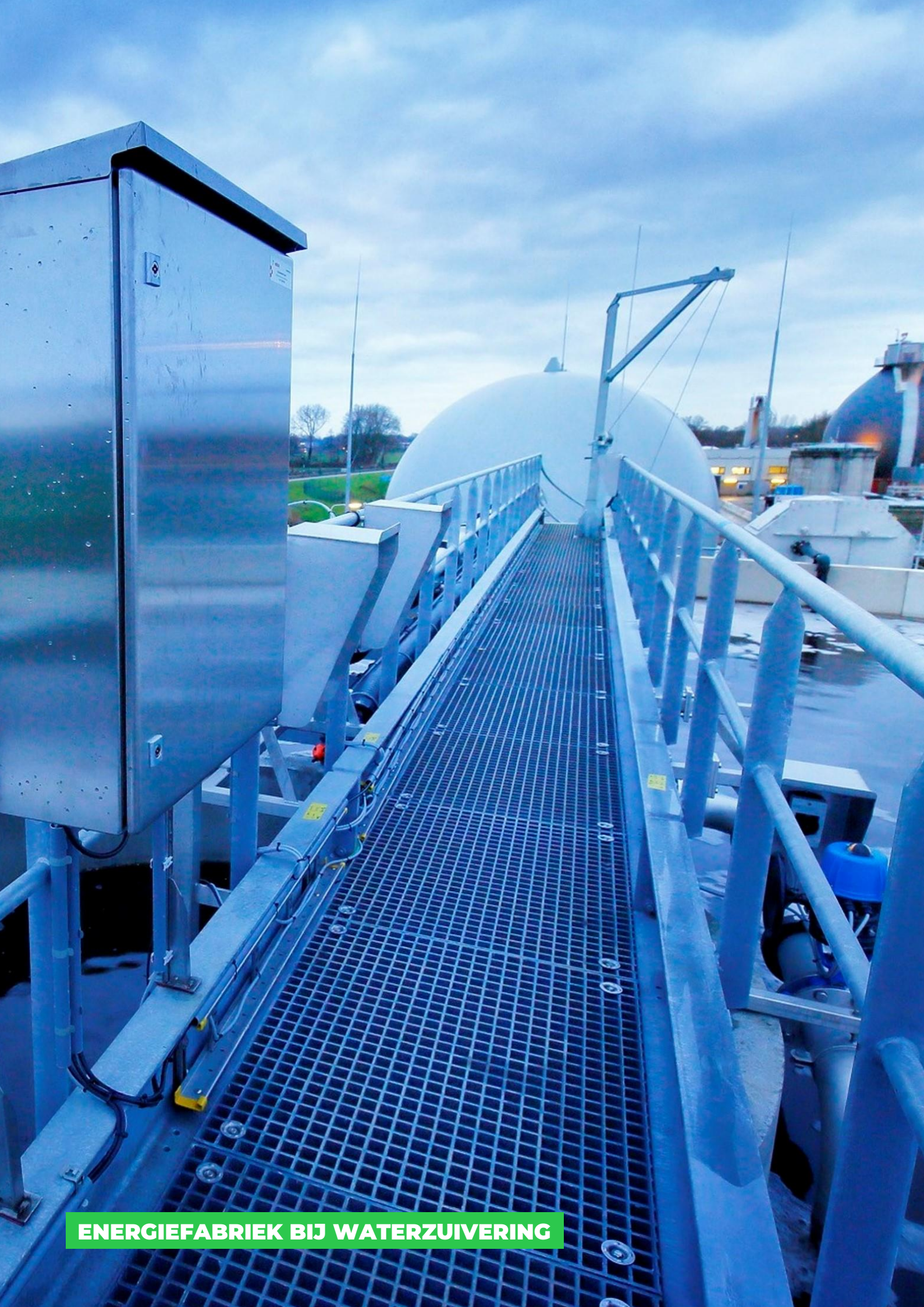
ENERGIEFABRIEK BIJ WATERZUIVERING